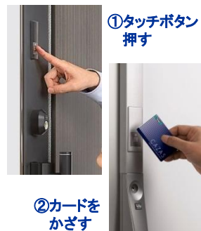
①タッチボタン 押す

※タッチ/ノータッチ切替キーシステムには 自動施錠ON・OFF機能はありません。